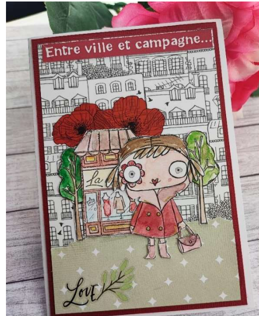
Coralie - CD Créations La Box de Quiscrap