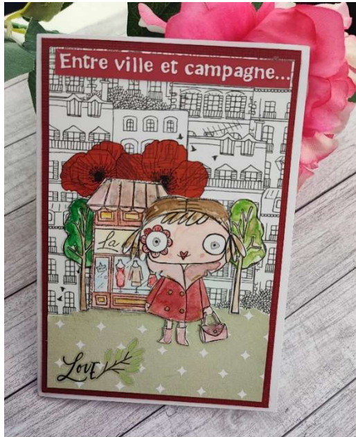
Coralie - CD Créations La Box de Quiscrap