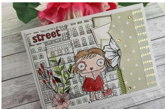
Coralie - CD Créations La Box de Quiscrap