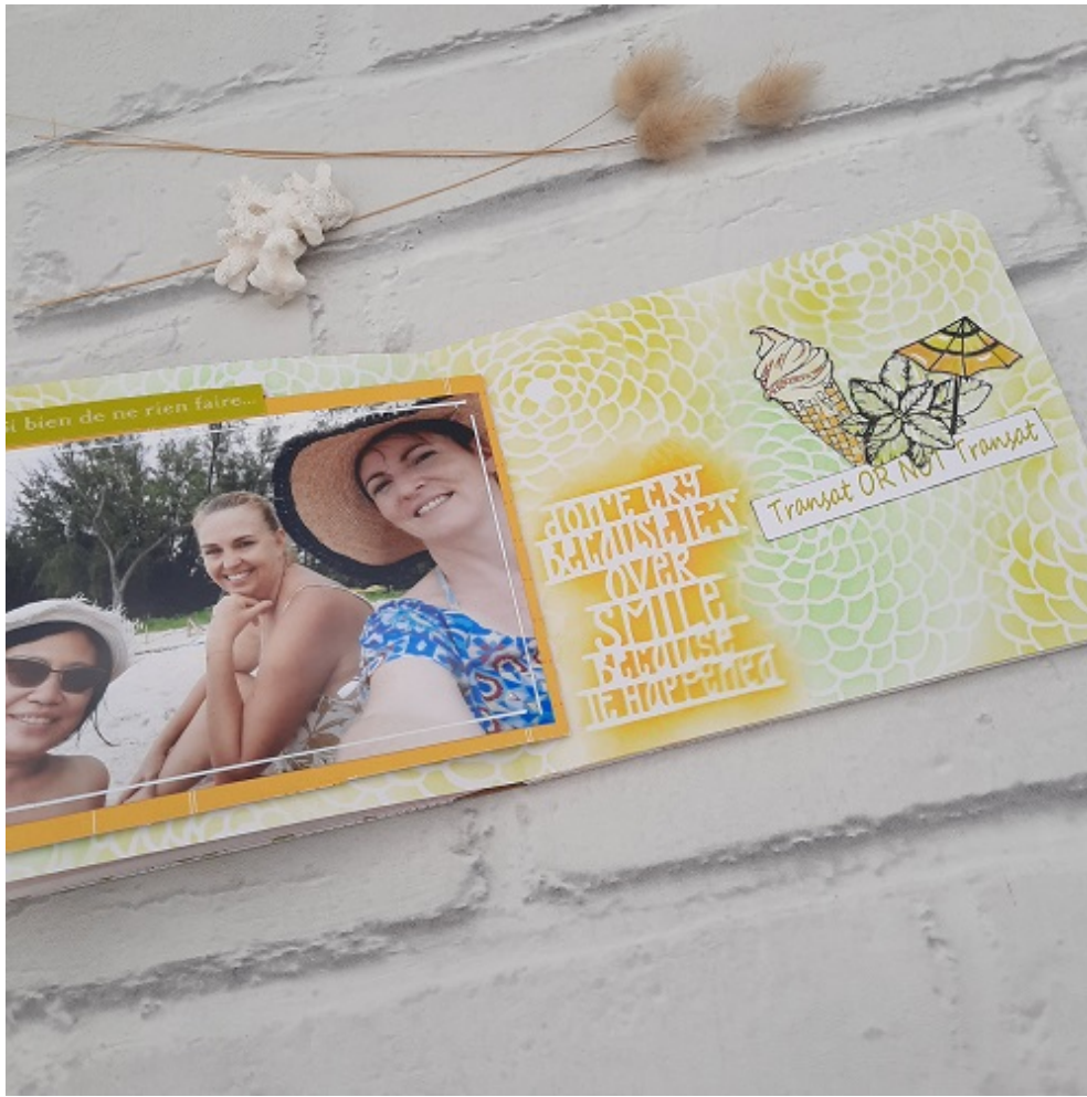
Double page 4