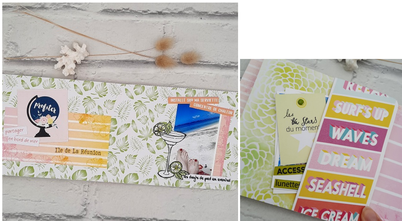
Devant et arrière de couverture.